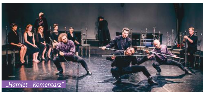
„Hamlet – Komentarz”