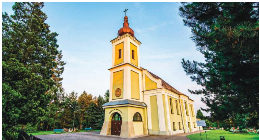
Kościół ewangelicko-augsburski w Golasowicach.

Prace budowlane w XVIII-wiecznym kościele ewangelicko-augsburskim w Golasowicach zakładają przywrócenie oryginalnego kształtu dachu sprzed zniszczeń, jakim uległ podczas II wojny światowej. Nowe pokrycie dachu będzie wykonane zgodnie z zaleceniami Wojewódzkiego Konserwatora Zabytków. Prace obejmą też wymianę skorodowanych