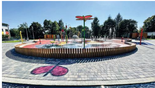
fol. UG Pawłowice

Grupa organizacji pozarządowych działających na terenie gminy Pawłowice wzbogaciła się o dwa nowe stowarzyszenia. Są to: Stowarzyszenie Mieszkańców Osiedla Pawłowice INICJATYWA oraz Krzyżowicko Baja. Życzymy owocnego działania!