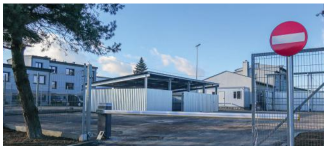
Nowoczesny PSZOK czynny 6 dni w tygodniu.