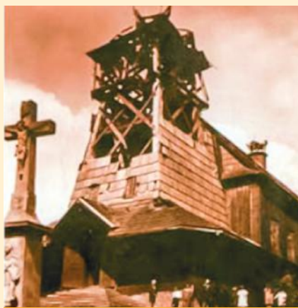
1945 r. Kościół w Pielgrzymowicach