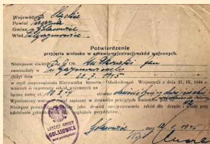
1946 r. Zaświadczenie przyjęcia wniosku o szkodach wojennych

Żyjemy nadal w piwnicy. Na froncie ściele się wielki atak. Rusczy przywieźli 10 Józef Stalin panzrów będą w nocy atakować, nie wiemy, czy przeżyjemy.