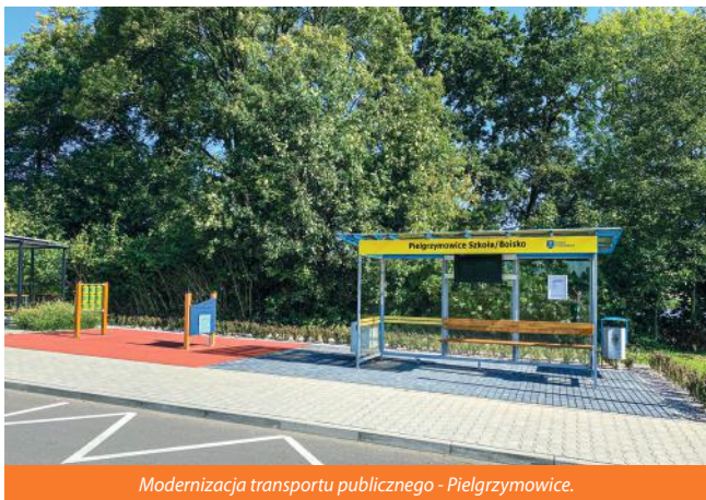
Modernizacja transportu publicznego - Pielgrzymowice.