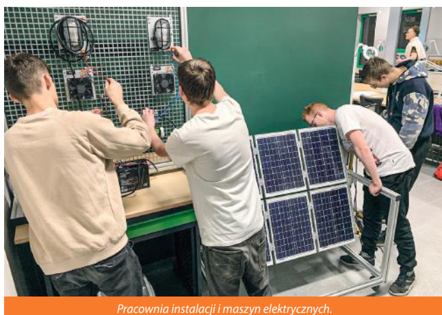
Pracownia instalacji i maszyn elektrycznych.