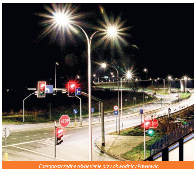
Energooszczędne oświetlenie przy obwodnicy Pawłowic.

Gmina nadal wnioskuje o środki unijne. Właśnie otrzymała 1,3 mln zł na budowę kolejnych instalacji fotowoltaicznych. Czekają też na decyzję w sprawie projektu za ok. 1 mln zł dla ZSO, w ramach którego mają powstać dwie pracownie: odnawialnych źródeł energii i sztucznej inteligencji.