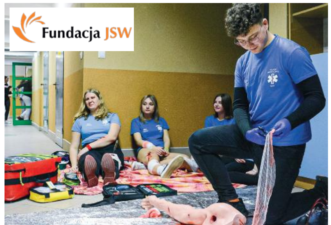
for. ZSO Pawłowice

Całkowity koszt realizacji przedsięwzięcia to 22 400 złotych, z czego 20 000 złotych to darowizna, zaś 2 400 złotych - środki własne szkoły. (UG Pawłowice, oprac. mn)