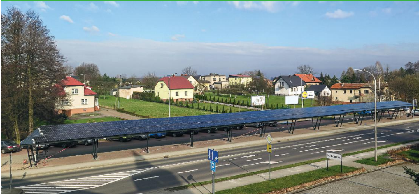
for. UG Pawłowice