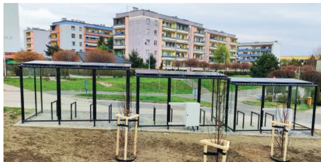
Panele na wiatkach przy centrum przesiadkowym na osiedlu.