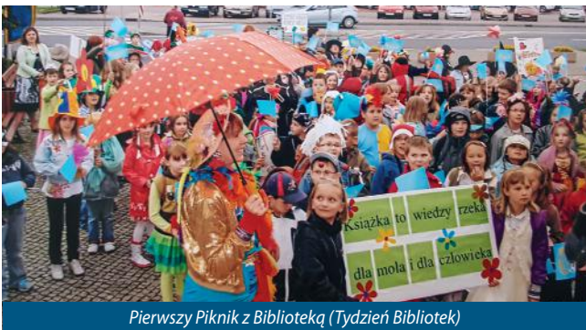
Pierwszy Piknik z Biblioteką (Tydzień Bibliotek)

Obchodzony w tym roku jubileusz pięćdziesięciolecia gminy Pawłowice wiąże się z jubileuszem biblioteki, która właśnie wówczas stała się placówką gminną. Jednak czytelnictwo ma tu znacznie dłuższą tradycję - w tym roku mija 75 lat od utworzenia Gromadzkiej Biblioteki Publicznej, która miała siedzibę w szkole podstawowej w Warszowicach. W 1954 roku księgozbiór przeniesiono do Pawłowic. W 1973 roku, gdy na mocy kolejnej reformy przywrócono podział na gminy, biblioteka gromadz-