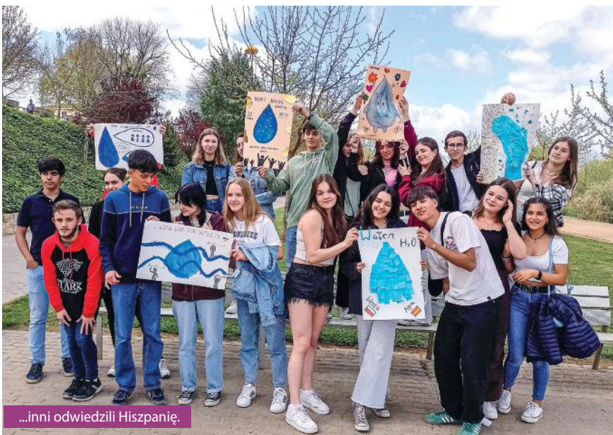
...inni odwiedzili Hiszpanię.

Jeszcze w tym roku szkolnym znajomi z południowej Europy przyjadą do Pawłowic z rewizytą - Włosi w maju, a Hiszpanie w czerwcu. Tymczasem ZSO w lutym wnioskowało o akredytację z Erasmus na przyszły rok. Według wstępnych planów byłyby to dwa wyjazdy grup młodzieży, a także długoterminowe (minimum miesięczne), indywidualne wyjazdy uczniów, z których mogłoby skorzystać kilka osób. Szkoła wnioskowała też o fundusze na kurs dla nauczycieli. Trzymamy kciuki, by się udało!