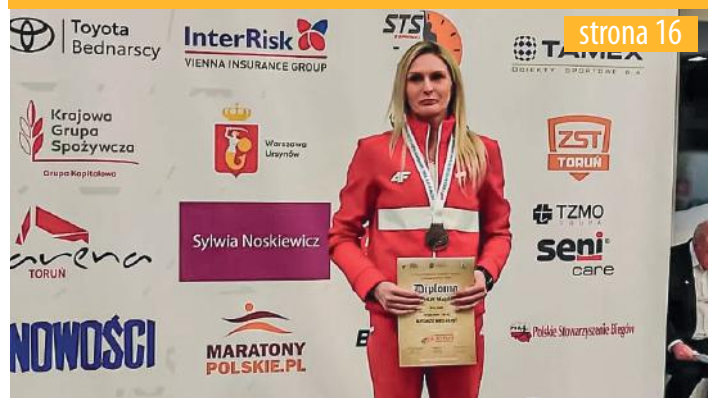
for. arch. M. Stuchlik