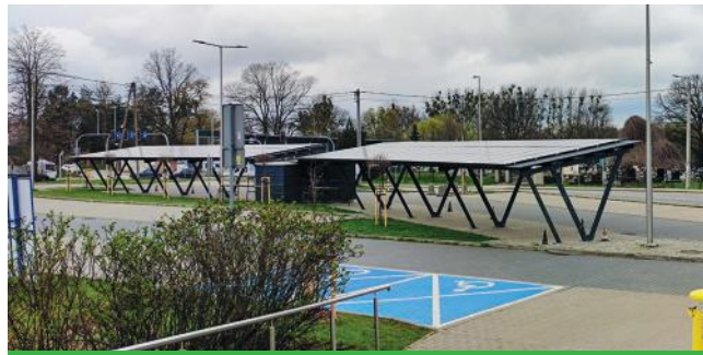
Instalacje na parkingach w Warszawie.