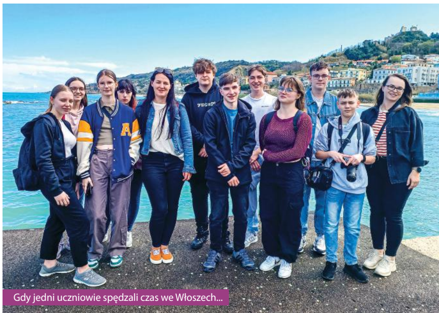
Gdy jedni uczniowie spędzali czas we Włoszech...

Dziesięcioro uczniów ZSO w Pawłowicach spędziło kilka kwietniowych dni w słonecznej Hiszpanii. Taka sama grupa pojechała w tym czasie do Włoch.