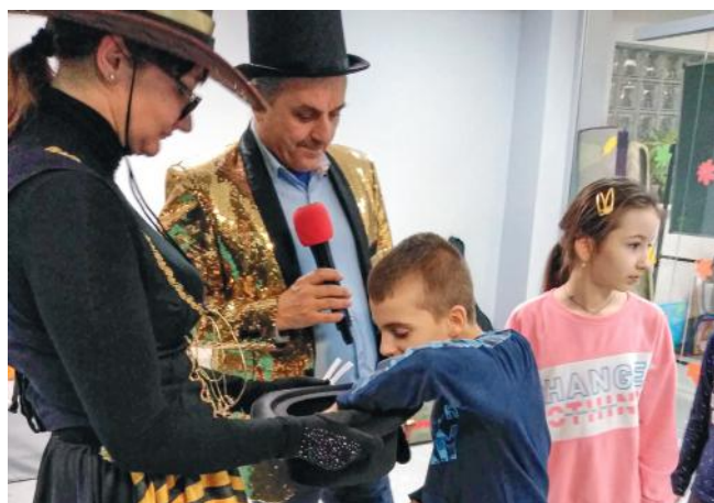
fort. OPS Pawłowice