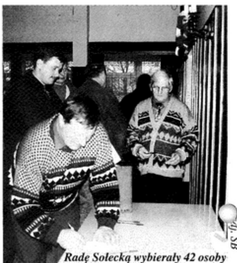
Radę Sołecką wybierały 42 osoby