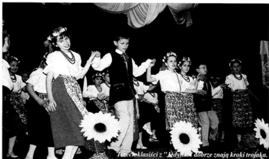
Teccwklasiści z "Jedynim dobrze znają kroki trojaka." sb