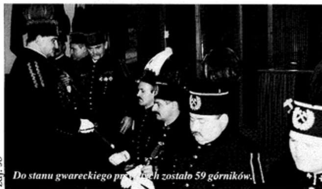
Do stanu gwareckiego poprzez kopalnię zostało 59 górników.