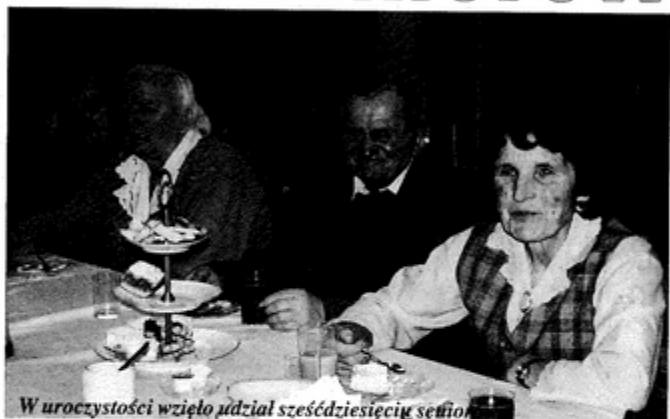
W uroczystości wzięło udział sześćdziesięciu seniorów

Zaproszenia do udziału w uroczystości Rada Sołectwa wystosowała do 80