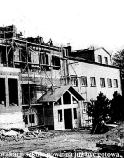
Do końca wakacji szkoła powinna już być gotowa.