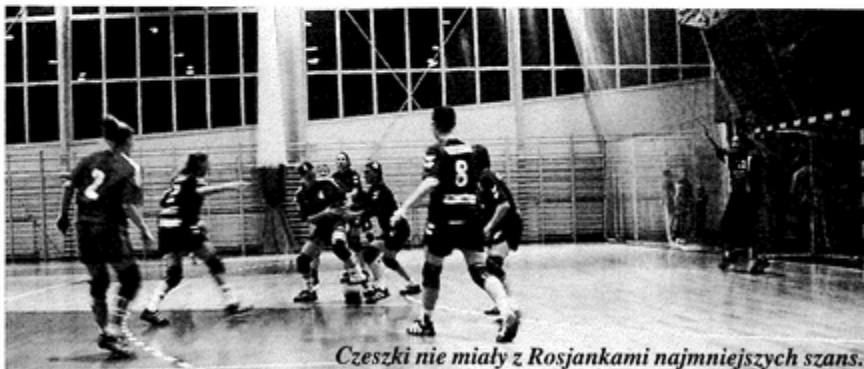
Czeszki nie miały z Rosjankami najmniejszych szans.