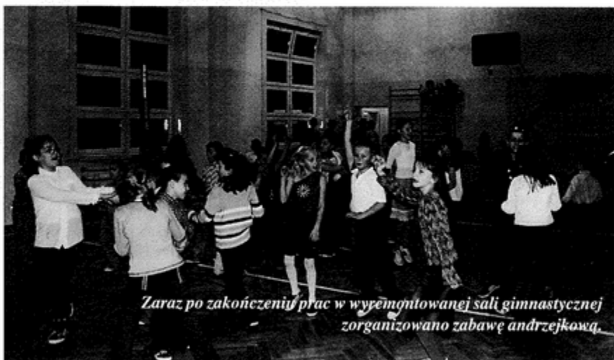
Zaraz po zakończeniu prac w wyremontowanej sali gimnastycznej zorganizowano zabawę andrzejkową.