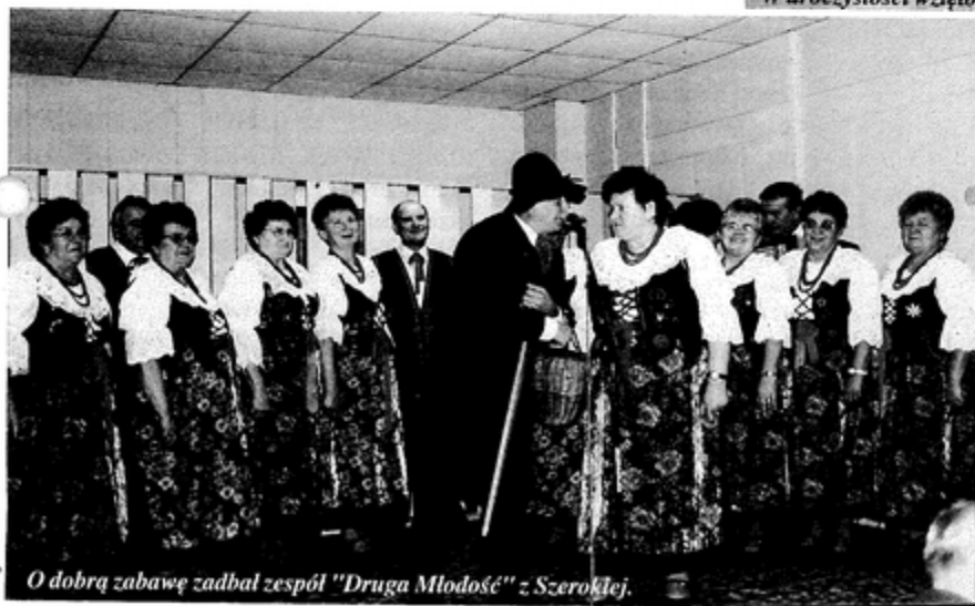
O dobrą zabawę zadbał zespół "Druga Młodość" z Szerokiej.