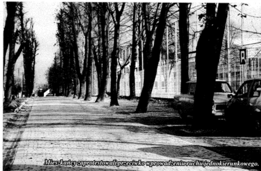
Mieszkańcy zaprotestowali przeciwko wprowadzeniu ruchu jednokierunkowego.

Pomysł ograniczenia ruchu na ul. Szkolnej pojawił się w związku z jej przebudową oraz z powodu bliskości koły i powstającego tam kompleksu sportowego. W zamiśle wykonawców droga ta miała stać się deptakiem, po którym poruszano by się w kierunku osiedla lub Gminnego Ośrodka Sportu. Z planów nic nie wyszło, bo na taki pomysł