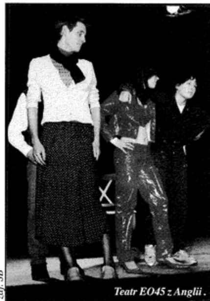
Teatr EO45 z Anglii.

Poniedziałek, 27 października był bowiem