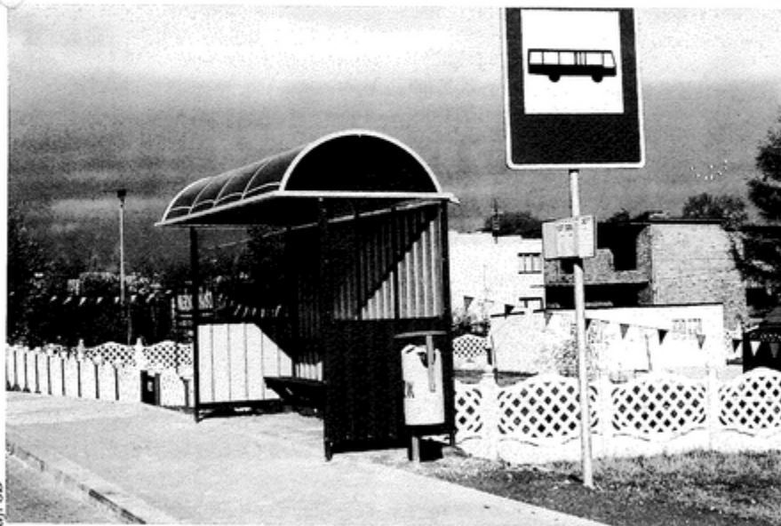
Wiaty są ładne i powinny długo służyć mieszkańcom. Tak się jednak nie stanie, jeżeli będą „ozdabiane” malowidłami i pozbawiane szyby.

Nowoczesne wiaty wykonał Zakład Wielobranżowy „Sopel” z miejscowości Białe Błota. Każda z nich kosztowała 2 tys. 400 zł. SB