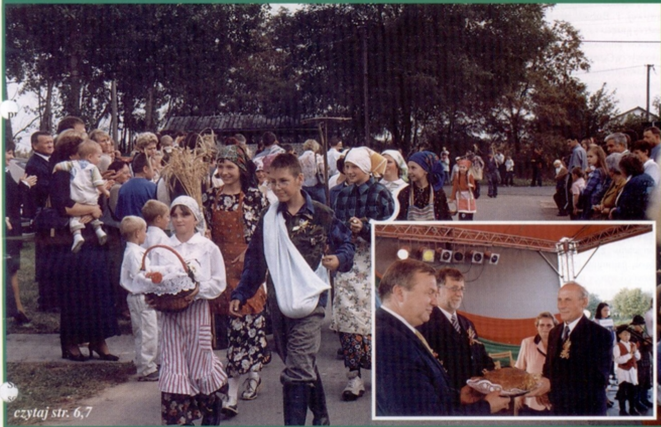
czytaj str. 6,7