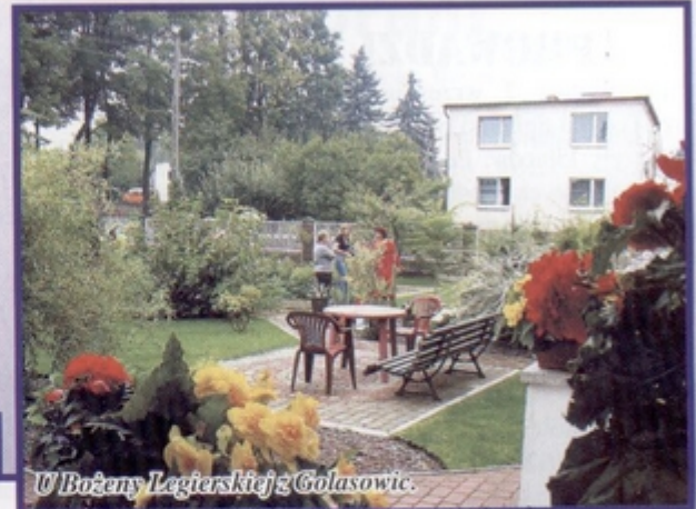
U Bożeny Legierskiej z Golasowic.