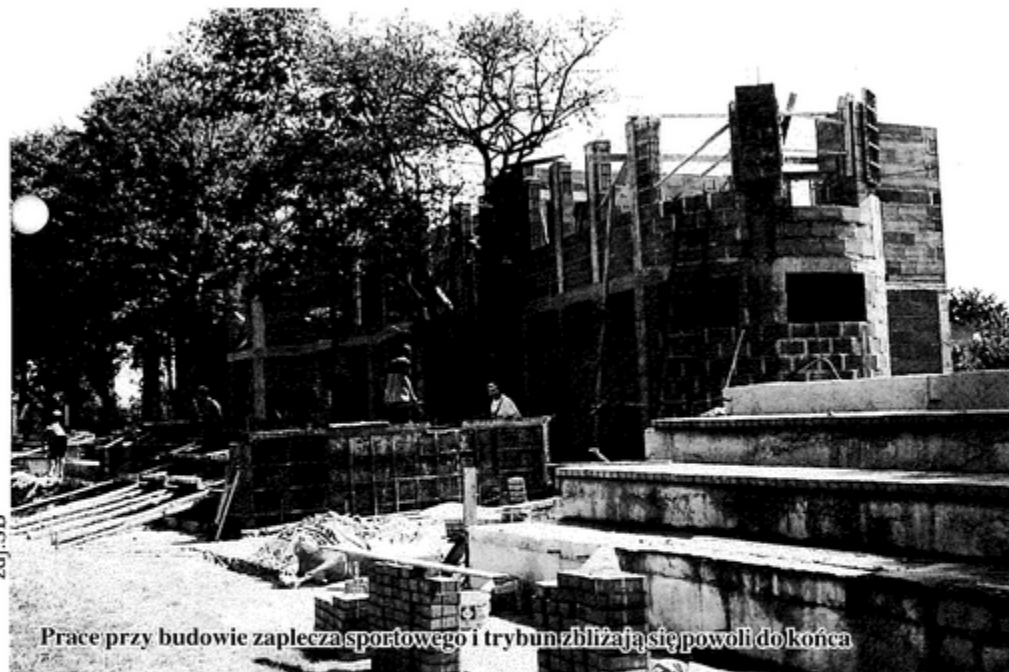
Prace przy budowie zaplecza sportowego i trybun zbliżają się powoli do końca

Dotychczas mówiło się o kompleksie boisk sportowych złożonym z dużego boiska trawiastego, boiska treningowego do piłki nożnej, a także boiska do siatkówki oraz do tenisa ziemnego.