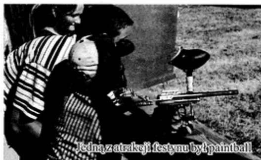
Jedną z atrakcji festynu był paintball

1962 roku oraz rosyjską ciężarówkę gaz 51 a z czasów II wojny światowej. – Ziła zarejestrowałem 3 lata temu. Mogę nim jeździć wszędzie, ale najczęściej wybieram się z chłopkami do lasu, gdzie testujemy jego możliwości. A jest co testować – bo ma