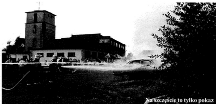
Na szczęście to tylko pokaz