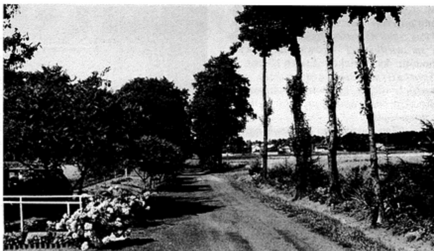
Niedaleko tej drogi biegnie granica prusko - austriacka

Pod protestem wystosowanym do gminy podpisały się wszystkie rodziny. Zamiast Cesarskiej mieszkańcy zapro-