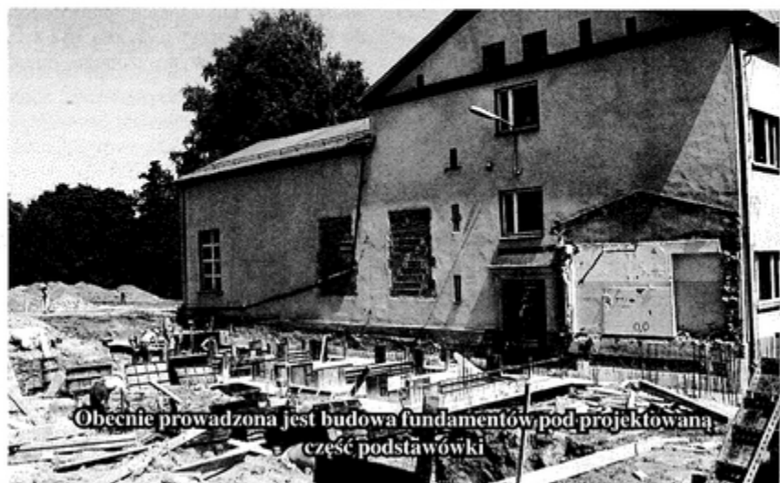
Obecnie prowadzona jest budowa fundamentów pod projektowaną część podstawówki

Poza robotami w starej części szkoły, prowadzona jest budowa fundamentów pod projektowaną część podstawówki. W dalszej kolejności powstaną fundamenty pod przedszkole. SB