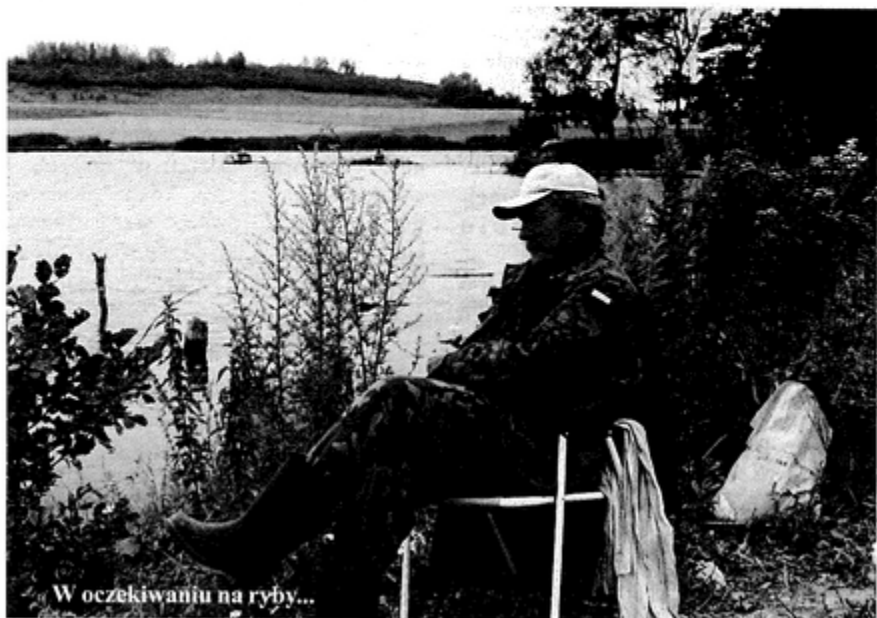
W oczekiwaniu na ryby...