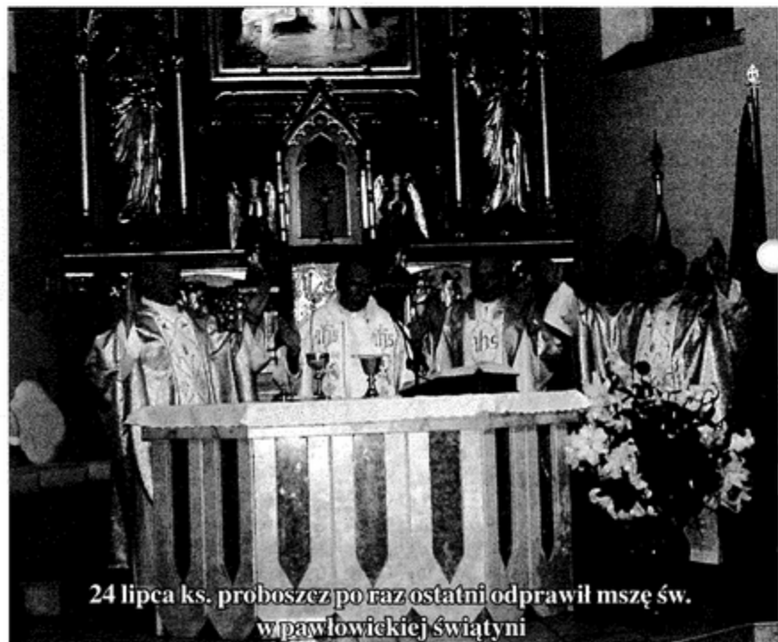
24 lipca ks. proboszcz po raz ostatni odprawił mszę św. w pawłowickiej świątyni

Jego droga do kapłaństwa była prosta i jasna. Już od IV klasy szkoły podstawowej był ministrantem. - W czasie jednej z wycieczek szkolnych do Częstochowy kupiłem sobie nawet monstrancję. Poszedłem z nią do kościelnego i zapytałem