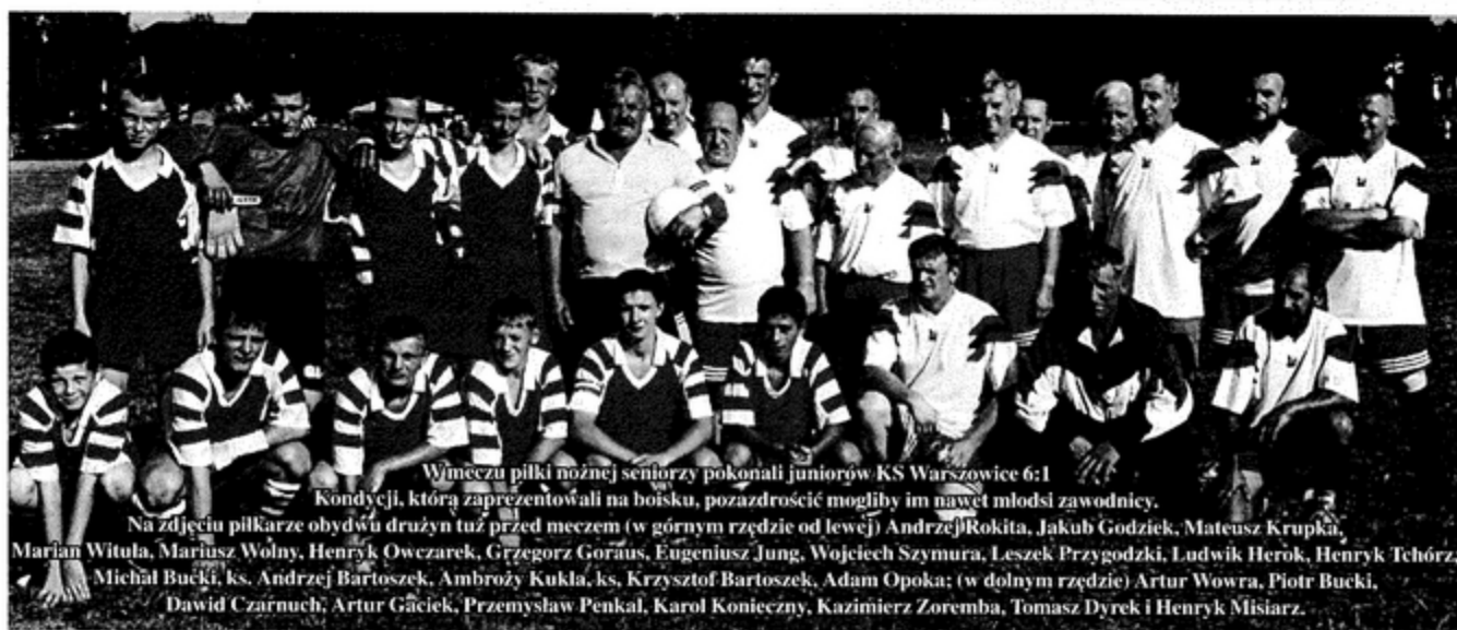
W meczu piłki nożnej seniorzy pokonali juniorów KS Warszowice 6:1

Kondycję, którą zaprezentowali na boisku, pozazdrościć mogliby im nawet młodzi zawodnicy.