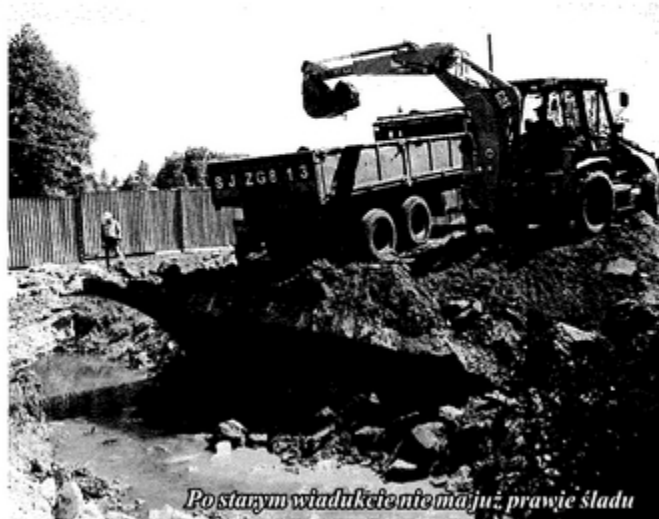
Po starym wiadukcie nie mają już prawie śladu